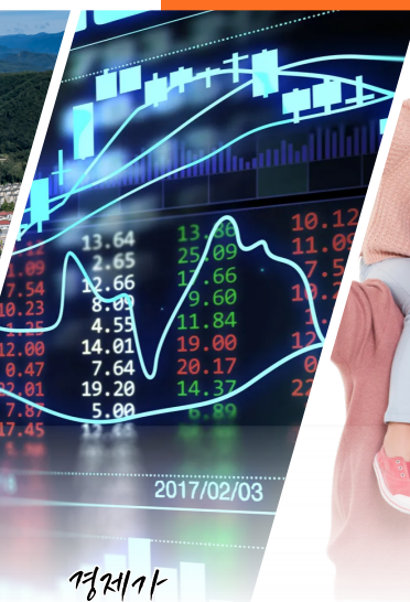
경제가 살아나는 양구