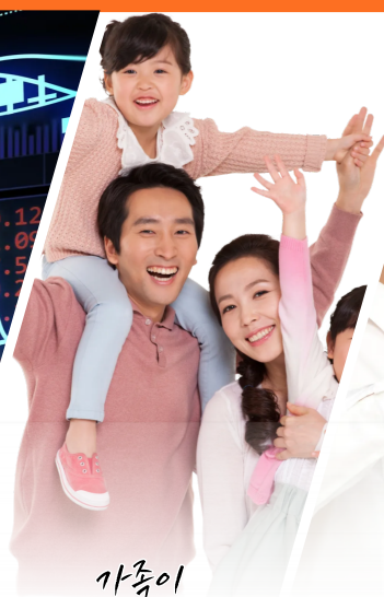
가족이 행복한 양구