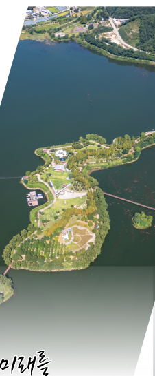
미래를 여는 양구