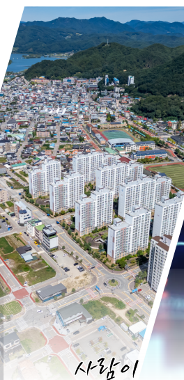
사랑함이 모이는 양구