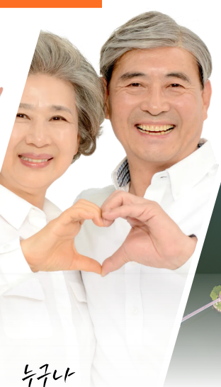
누구나 편안한 양구