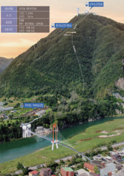
영월 봉래산 명소화사업