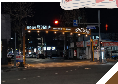
포남동 먹거리촌 조형물