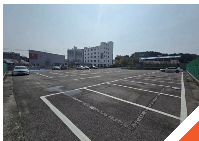
중앙고 옆 공영주차장 신설