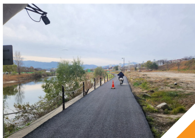
고수부지 자전거도로 재포장