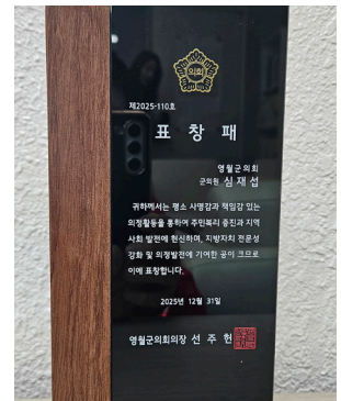
2025.12.31. 영월군의회 의장상 수상