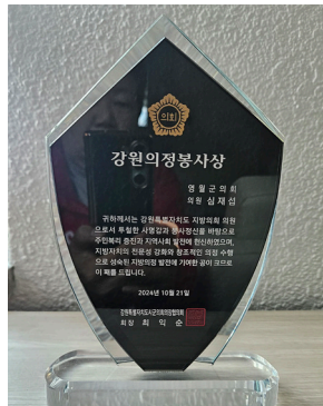
2024.10.21. 강원의정 봉사상 수상