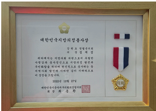
2022.12.27. 대한민국지방의정봉사상 수상