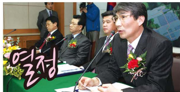
예산을 따라 문턱이 닳도록 수십 번 찾아가자 "군수님, 그만 오셔도 됩니다!" 소리도 들었습니다.