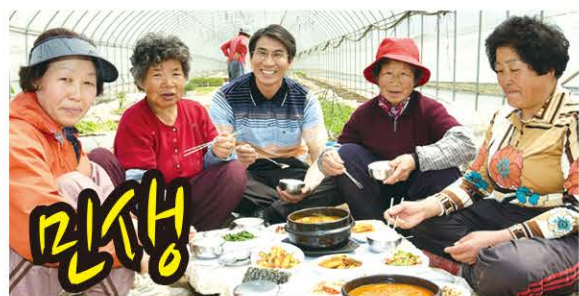
골목상권과 민생현장에서 답을 찾아 농가소득을 올리고 지역경제를 살렸습니다.