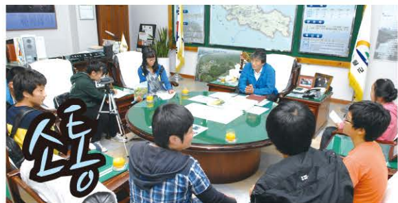
군수실을 1층으로 내려 부모님 섬기듯 군민과 소통하니 행정이 보이고 현안이 술술 풀렸습니다.