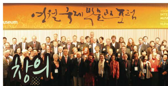
군민과 공무원이 함께하는 창의행정으로 단종 국장을 재현하고 박물관 창조도시를 만들었습니다.