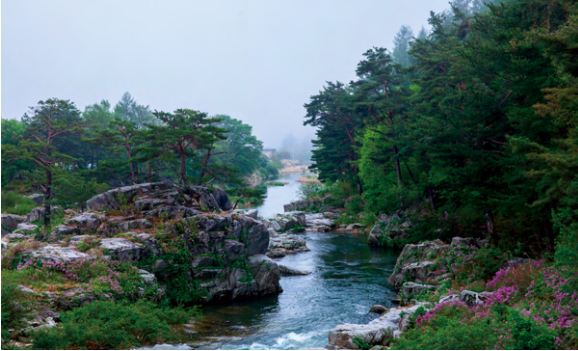
평창의 산과 강에서 평창의 미래를 열겠습니다.

전나무와 소나무를 향기공장으로 만들겠습니다 자연향 시장이 세계적으로 커지고 있습니다. 평창의 나무와 꽃에서 추출하는 자연유래성분을 재료로 향기와 화장품 재료를 생산해 평창 대표 산업으로 키우겠습니다.