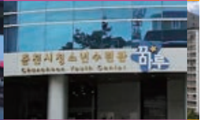
백령로 청소년수련관 본점