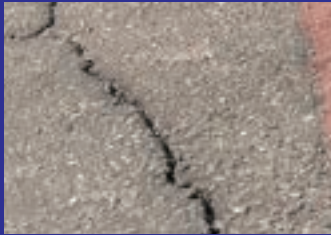
퇴계동 인도 및 건물목