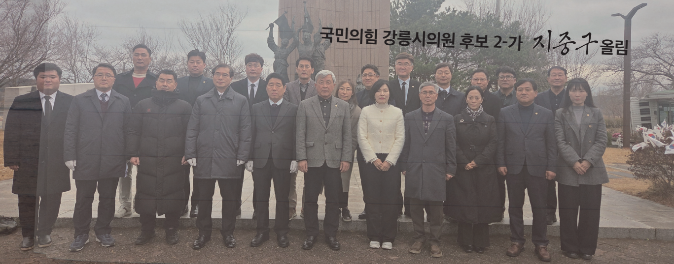
국민의힘 강릉시의원 후보 2-가 지중구 올림

시민 여러분의 곁에서, 시민의 마음을 가장 잘 헤아리는 든든한 일꾼이 되겠습니다. 강릉의 기분 좋은 변화, 지중구가 함께하겠습니다.